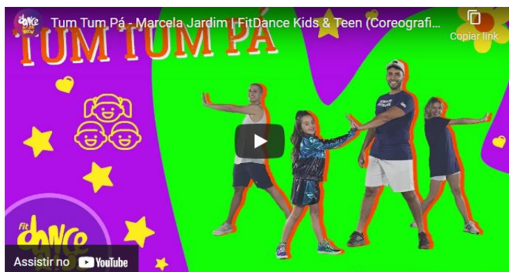
Figura 14 - Coreografias de fácil execução.