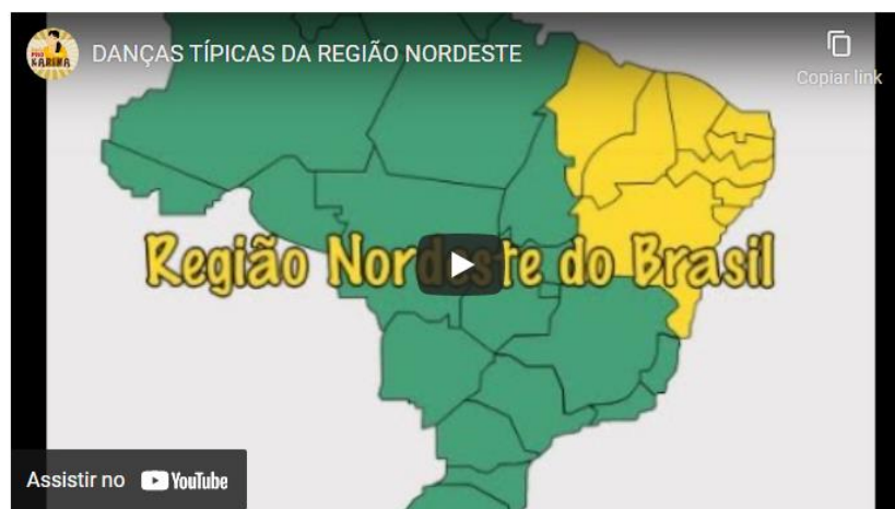
Figura 6 - As danças típicas da Região Nordeste

Competências: Compreender as linguagens como construção humana, histórica, social e cultural, de natureza dinâmica, reconhecendo-as e valorizando-as como formas de significação da realidade e expressão de subjetividades e identidades sociais e culturais.