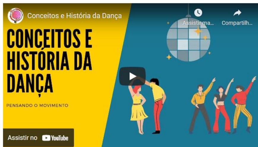
Figura 2 - Conceitos e História da dança.