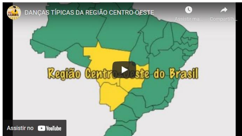
Figura 8 - As danças típicas da Região Centro-Oeste.