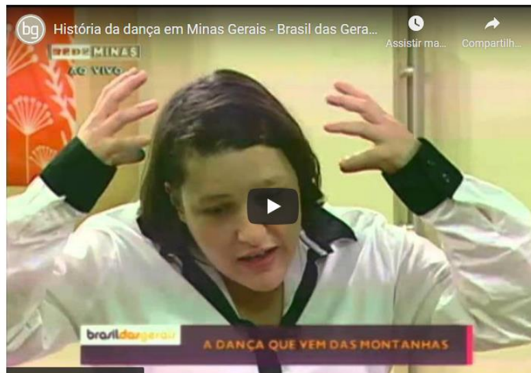
Figura 3 - História da dança em Minas Gerais - parte 1.

Competências: Compreender as linguagens como construção humana, histórica, social e cultural, de natureza dinâmica, reconhecendo-as e valorizando-as como formas de significação da realidade e expressão de subjetividades e identidades sociais e culturais.