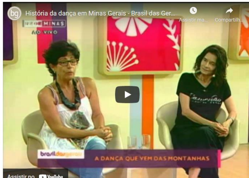
Figura 4 - História da dança em Minas Gerais - parte 2

Competências: Compreender as linguagens como construção humana, histórica, social e cultural, de natureza dinâmica, reconhecendo-as e valorizando-as como formas de significação da realidade e expressão de subjetividades e identidades sociais e culturais.