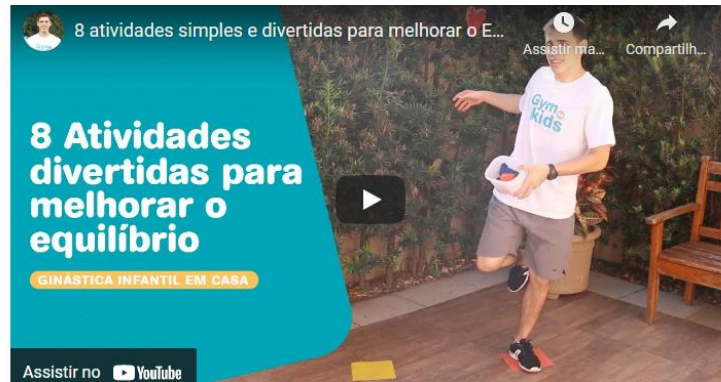
Figura 12 - Exercícios para crianças e adolescentes

significados atribuídos às diferentes práticas corporais, bem como aos sujeitos que delas participam.