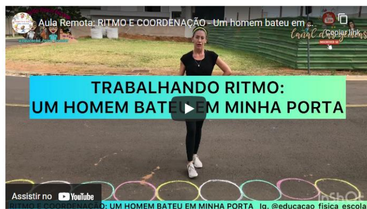
Figura 13 - Exercícios para crianças e adolescentes

Competências: Planejar e empregar estratégias para resolver desafios e aumentar as possibilidades de aprendizagem das práticas corporais, além de se envolver no processo de ampliação do acervo cultural nesse campo; Interpretar e recriar os valores, os sentidos e os significados atribuídos às diferentes práticas corporais, bem como aos sujeitos que delas participam.