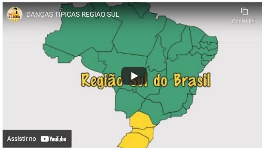
Figura 7 - As danças típicas da Região Sul.

Competências: Compreender as linguagens como construção humana, histórica, social e cultural, de natureza dinâmica, reconhecendo-as e valorizando-as como formas de significação da realidade e expressão de subjetividades e identidades sociais e culturais.