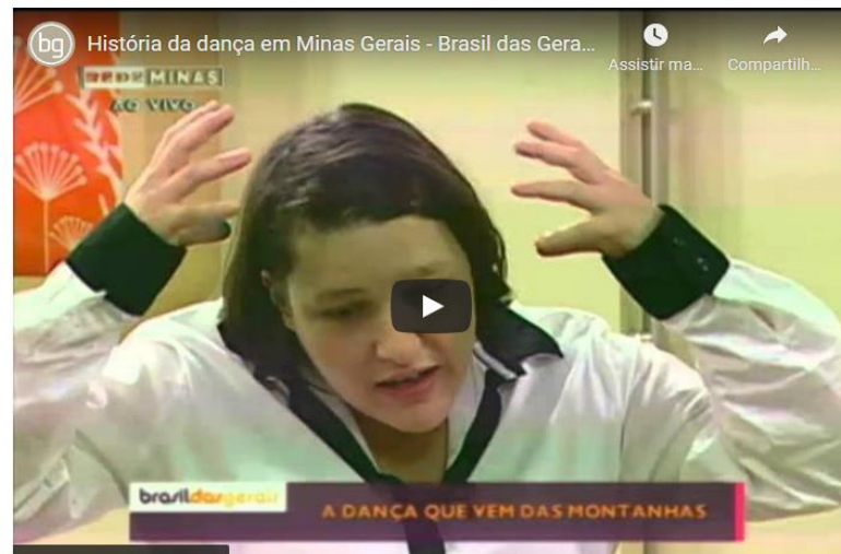
Figura 5 - História da dança em Minas Gerais - parte 3