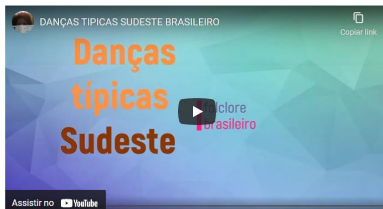
Figura 9 - As danças típicas da Região Sudeste.

Competências: Compreender as linguagens como construção humana, histórica, social e cultural, de natureza dinâmica, reconhecendo-as e valorizando-as como formas de significação da realidade e expressão de subjetividades e identidades sociais e culturais.