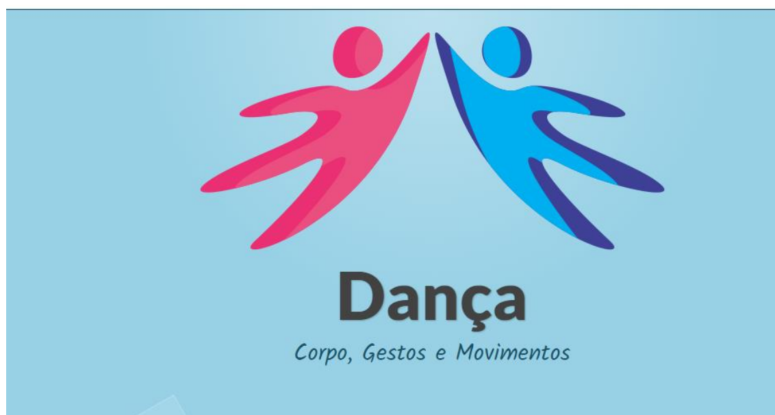
Figura 1 - Capa do produto educacional.

A Plataforma encontra-se disponível para acesso e consulta no link : http://mestredomovimento952613280.wordpress.com