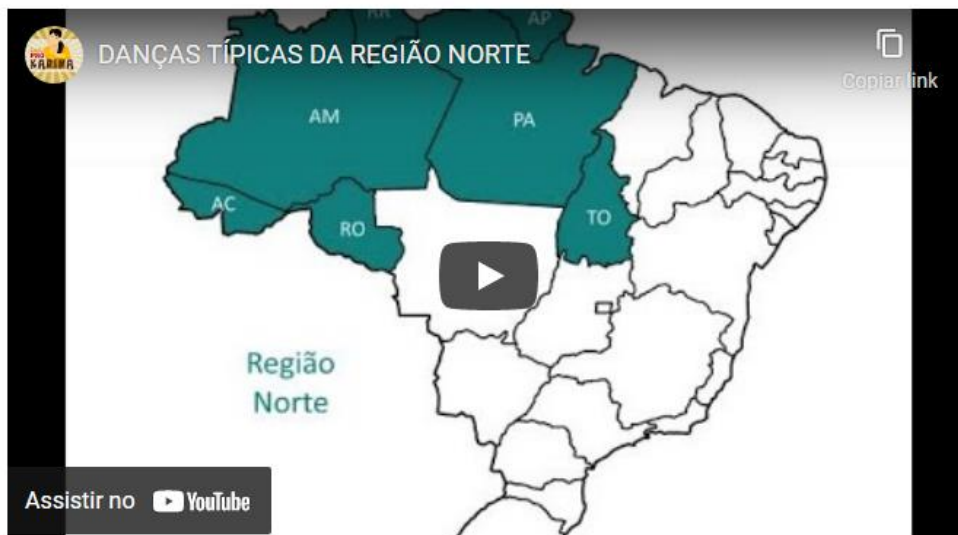
Figura 10 - As danças típicas da Região Norte.

Competências: Compreender as linguagens como construção humana, histórica, social e cultural, de natureza dinâmica, reconhecendo-as e valorizando-as como formas de significação da realidade e expressão de subjetividades e identidades sociais e culturais.