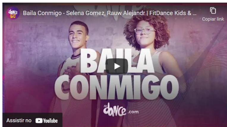
Figura 15 - Coreografias de fácil execução.